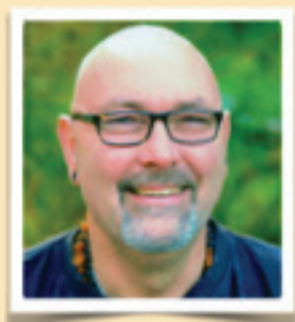
zu meiner Person

und vielen Dank, dass Sie sich für meine Seminare interessieren.